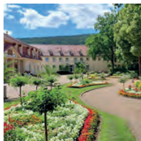
Kurhaushotel Bad Bocklet

Mittwochsgespräche, jeweils 19:30 Uhr im kleinen Kursaal